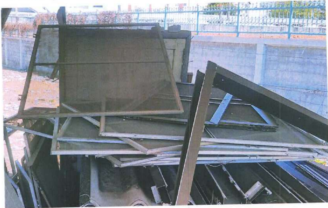
รายการที่ 23 มุ้งลวด จำนวน 25 บาน