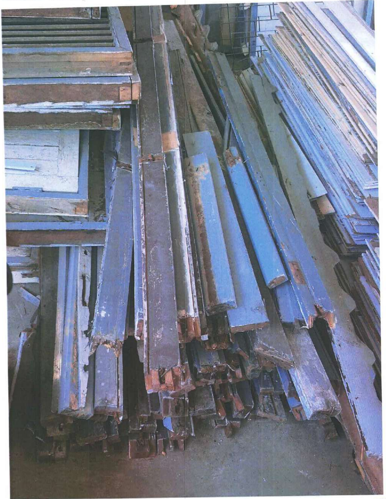
รายการที่ 25 วงกบประตู จำนวน 8 ชุด