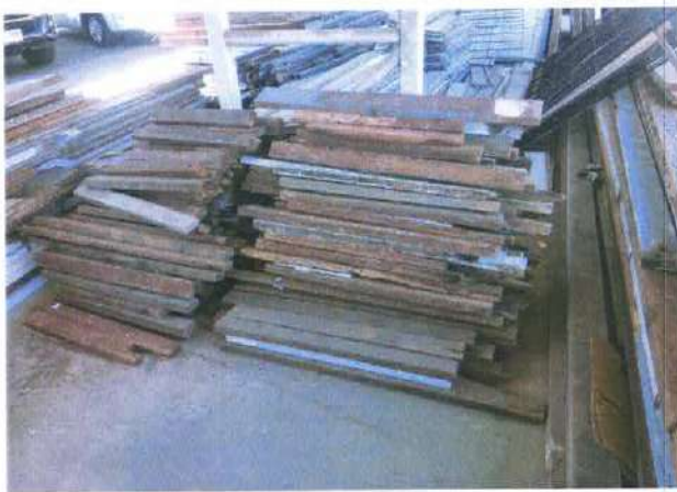
รายการที่ 8. ไม้ขนาด 1 ½x 3 นิ้ว ยาว 0.6-1 เมตร จำนวน 200 ชิ้น